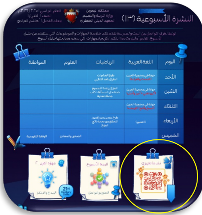
نشاط بأداة Wordwall في كل نشرة أسبوعية

في إطار التوجه نحو التعليم الأخضر، تم تفعيل الأدوات الرقمية داخل الصف الدراسي بهدف دعم التعليم التفاعلي، وتقليل الاعتماد على الورق، وتعزيز وعي الطلبة بمفاهيم الاستدامة البيئية بما ينسجم مع أهداف التنمية المستدامة